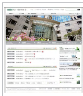
NTT都市開発ホームページ

NTT都市開発グループは、CSR経営において、ステークホルダーの皆さまとのコミュニケーションが非常に重要であると考えています。CSR報告書のほかにも、さまざまなコミュニケーション・ツールを整備し、ステークホルダーの皆さまとの対話に努めています。