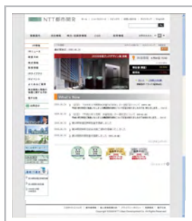
「株主・投資家情報」サイト