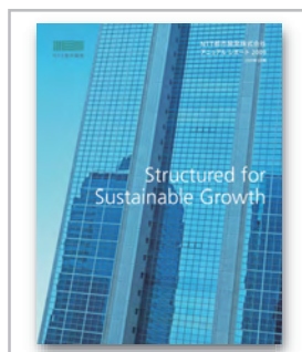
アニュアルレポート2009