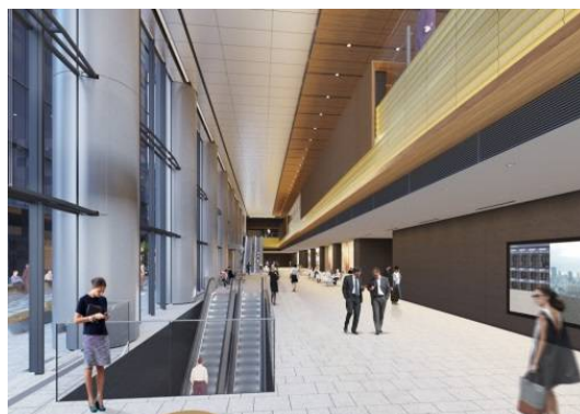
セントラルプロムナード