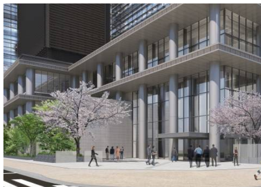
イーストタワー側エントランス(外観)