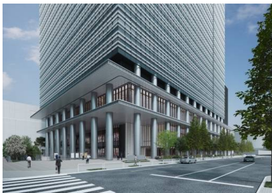
ウェストタワー側エントランス(外観)