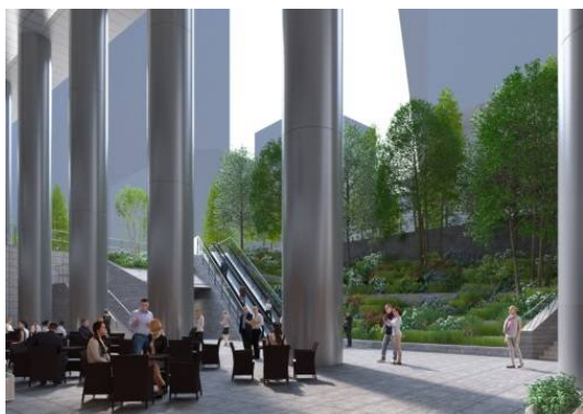
サンクンガーデン