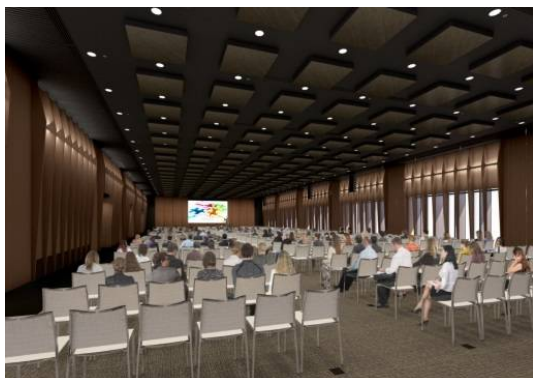
カンファレンスセンター