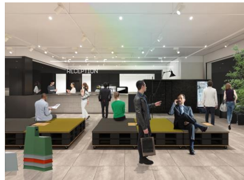
LIFORK Lab イメージ②