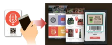
「スマートプレート」イメージ

上記以外に、大手町プレイス入居企業や LIFORK 会員、その他企業との協業も検討しております。