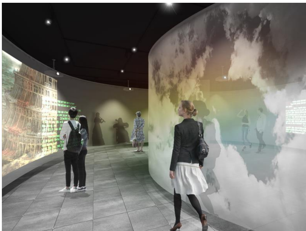
「ART Lab powered by GEIDAI COI」第1弾体験 空間パース

「OTEMACHI PLACE Lab」の提供を通じ、大手町プレイスおよび大手町エリアのさらなる活性化を図るとともに、実験的取り組み内容を今後の街づくりに活かしてまいります。