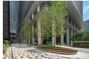
グリーンプロムナード

地下1階から地上2階には、多様なシーンにご利用いただける29店舗のショップ&レストランがあります。大手町から神田方面へ抜ける「グリーンプロムナード」や、緑に囲まれた「サンクンガーデン」とともに憩いの場を提供しております。