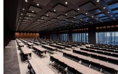
カンファレンスセンター

1・2階には、2分割可能な750㎡のホールおよび複数のカンファレンスルームを有する国際カンファレンスセンターがあります。高級感のある内装で、グローバルなカンファレンスから学術会議まで、多様なニーズにフレキシブルに対応いたします。