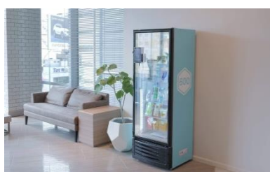
「無人コンビニ 600」イメージ

新たなテクノロジーの実験として、東日本電信電話株式会社が支援する、以下のベンチャー企業のテクノロジーの導入を予定しております。利用者に応じて品揃えをカスタマイズし、キャッシュレスで支払い可能な、600 株式会社の「無人コンビニ 600」を設置し、多様で便利な働き方を支援します。2,000 種類以上の世界の風景の放映が可能な、株式会社ランドスキップのバーチャルウィンドウ「Window Air」を設置し、閉塞感のある地下空間を癒される空間へ変えていきます。スマートフォンをかざすだけでモノや場所とオンライン（情報）をつなぐ、株式会社アクアビットスパイラルズの「スマートプレート」の設置により、様々な企業の最新のテクノロジーの情報を配信し、常に刺激を受けビジネスを加速させるきっかけを提供いたします。