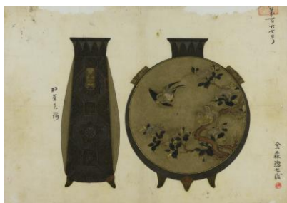
「花鳥文扁壺形花瓶下絵」

高岡市立博物館資料室で発見された「明治期の絵師たちが制作した下絵」、「明治期の実際の逸品」、「現代テクノロジーと職人により制作された明治期の再現モデル」を同時に展示し、時を超えたアートに触れていただけます。