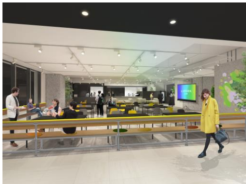
LIFORK Lab イメージ①

イベントスペースとして利用がない時間帯は、会員制のラウンジとして無料にご利用頂けます。好きな色のクッションを選んで、好きなコーヒーを自分で淹れて、好きな場所に座ってというように、ひとつひとつ自分で自由にカスタマイズしていく、そんな働き方を実現するスペースです。