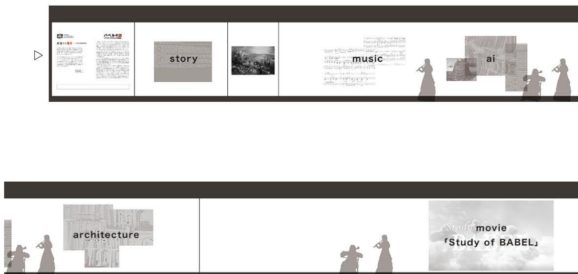
「ART Lab powered by GEIDAI COI」第1弾体験 展開図

世界有数のビジネス拠点「大手町」の最新高層ビルである大手町プレイス内で、世界有数の名画にまつわる情報の海を泳ぐような、芸術の奥深い一面を味わえる空間体験をお楽しみいただけます。