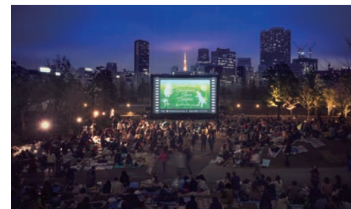
さまざまな世代が来場するオープンシアター

こうしたなか、2016年10月末のイベント「品川ハロウィン」は、地域の皆さまが企画し、当社が場所や音響などの設備を提供するという形で、地域の皆さまからもご好評を得ました。今後は、山手線新駅の開業（2020年に暫定開業）を見据え、引き続き地域の皆さまとの情報交換を通して港南エリアでの価値向上を図ります。