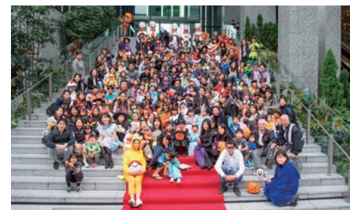
「品川ハロウィン」参加者集合写真