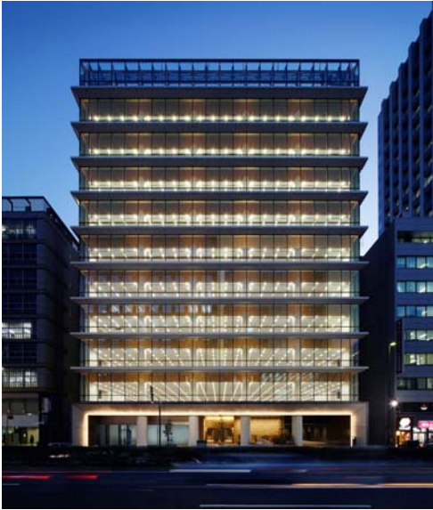
水平庇による開放感ある外観