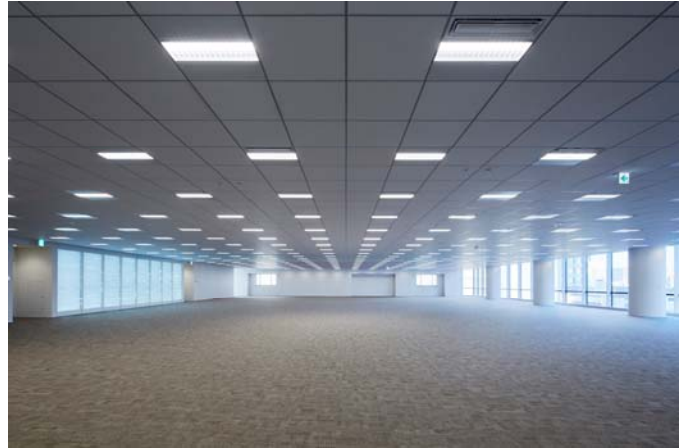
基準階オフィスには光ダクト（写真左側）により 4面採光の実現