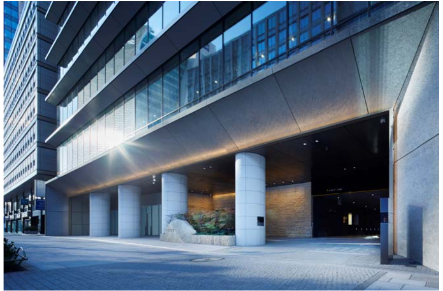
大庇によるおもてなしのエントランスゲート