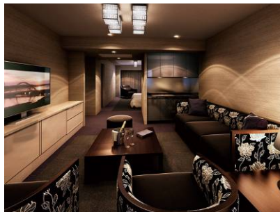
ゲストルーム「ラグジュアリースイート」 完成予想図