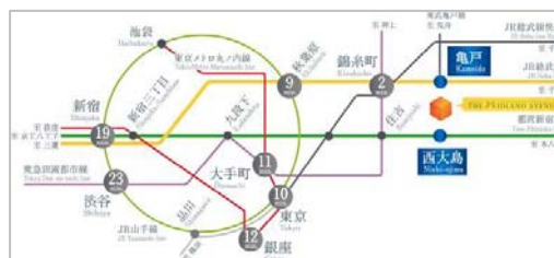
都心主要スポットへのアクセス

本物件は、JR総武線「亀戸」駅まで徒歩6分、都営新宿線「西大島」駅まで徒歩5分と駅近物件であり、東京駅まで10分（亀戸駅より）、銀座駅まで12分（亀戸駅より）、新宿まで19分（西大島駅より）と都心の主要スポットへのアクセスが良好です。通勤時間を短縮することで、家族の時間を創出できる立地となっています。