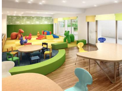
「親子カフェ」完成予想図 子供を見守りながらティータイムが愉しめるキッズコーナーとカフェコーナーをひとつにした空間。