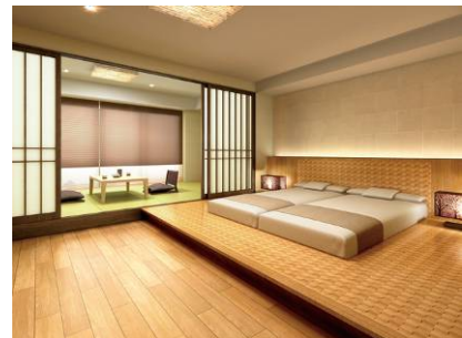
ゲストルーム「ジャパニーズスイート」 完成予想図