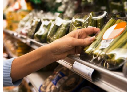
ミニショップ(※写真はイメージです) 育児用品に加え、調味料やティッシュペーパーなど身近に必要なものを取り揃えた深夜まで営業するミニショップ。