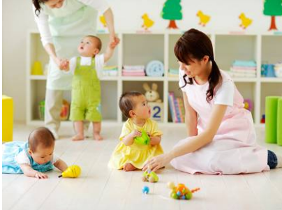
認可保育施設(※写真はイメージです) 0歳児～5歳児まで預けられる100名規模の認可保育施設。