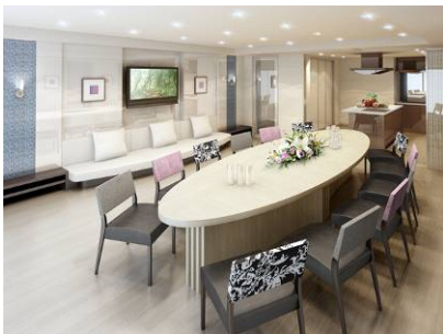
「パーティールーム」完成予想図