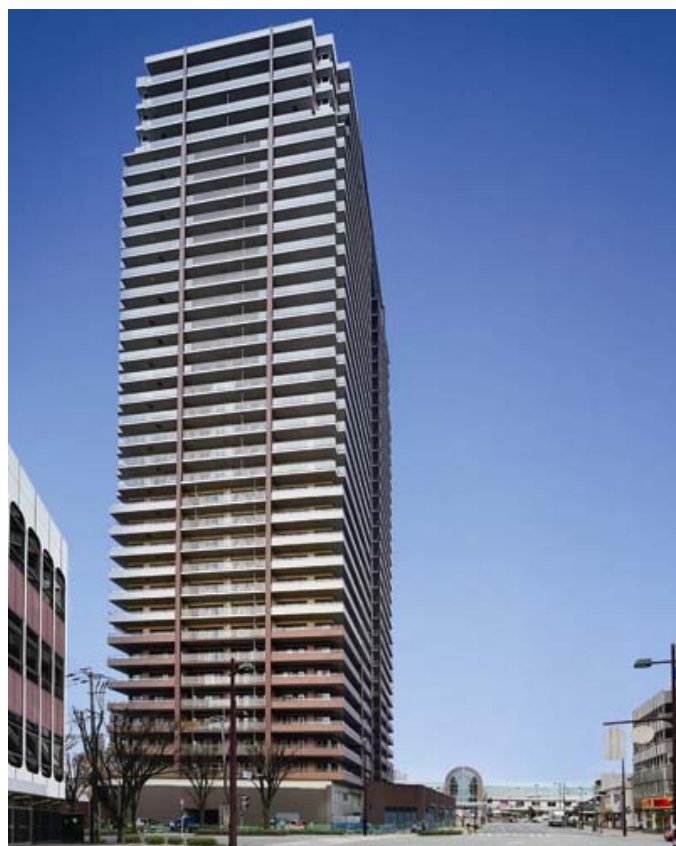
「ザ・ライオンズ久留米ウェリスタワー」竣工写真