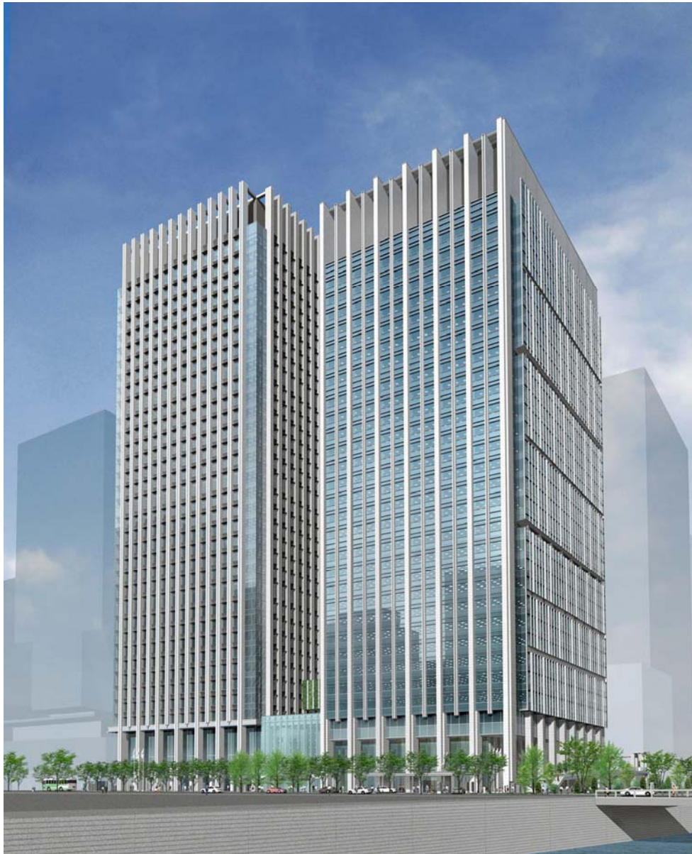
計画地北東方向から見たイメージ 向かって右より、A棟・B棟