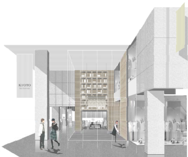
【メインエントランス】