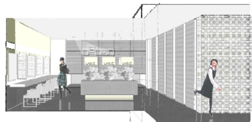
【パウダーコーナー（3階）】