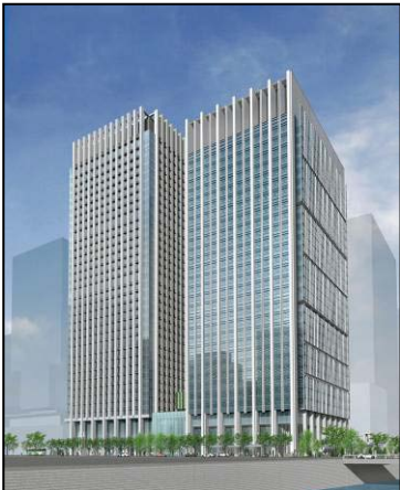
計画地北東方向から見たイメージ 向かって右側がノースタワー (A棟)