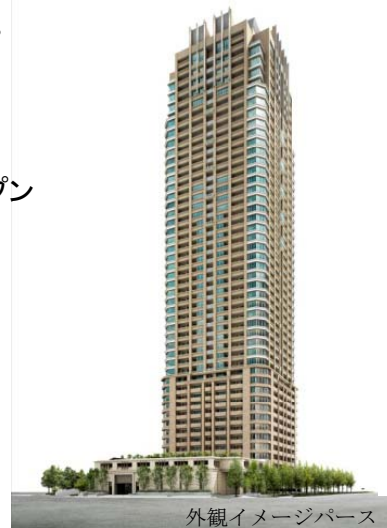
外観イメージパース