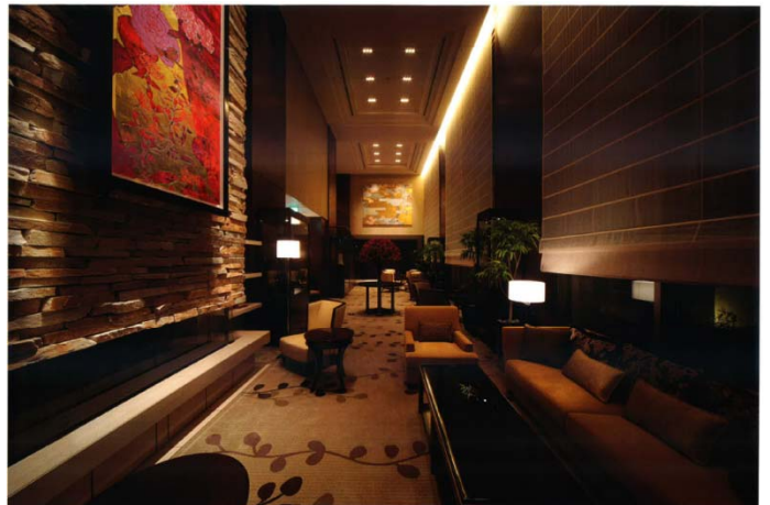
レセプションハウスでも体感できる「ザ・レセプション」(左)と「ザ・リビング」(右)