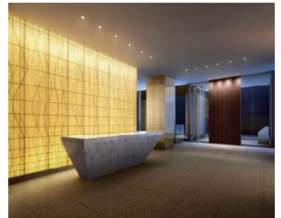
エントランスホール完成予想 CG