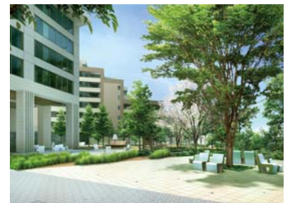
フォレストガーデン完成予想 CG