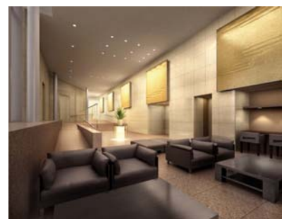
グランドロビー完成予想 CG