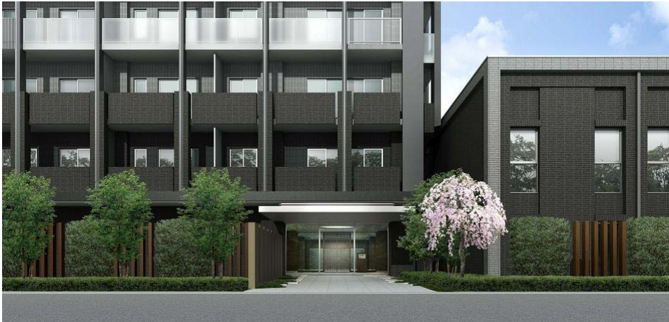
「ウェリス駒込レジデンス」完成予想図