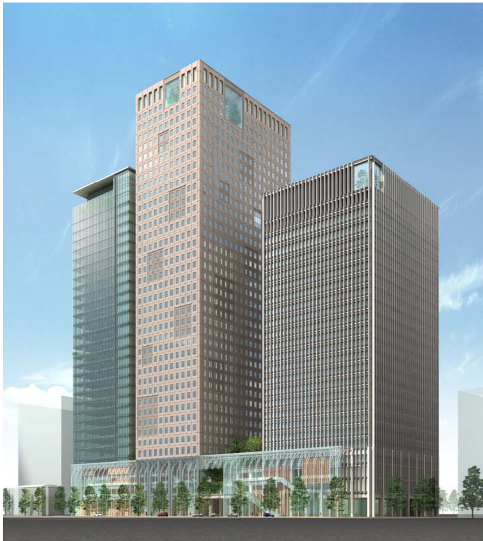
計画地東南方向から見たイメージ 向かって左よりA棟・B棟・C棟