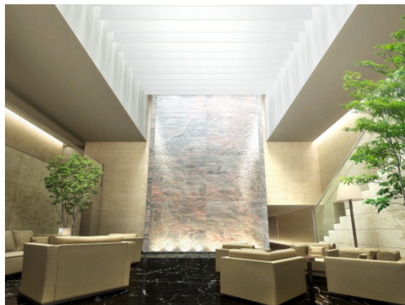
エントランスホール・ラウンジと水景壁

※掲載の完成予想CGIは、計画段階の図面を基に描き起こしたもので、実際とは異なります。尚、形状の細部、設備機器等は表現していません。