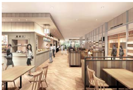
[フードコートイメージ]