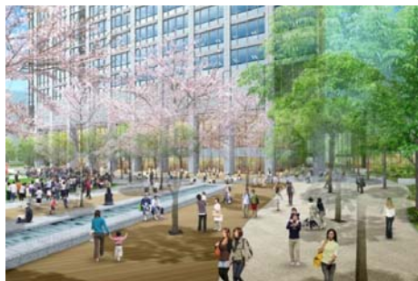
[北側緑地イメージ]

また商業ゾーンに加え、3階にはカンファレンス・ホールを設置し、講演会や展示会等企業活動を支えます。