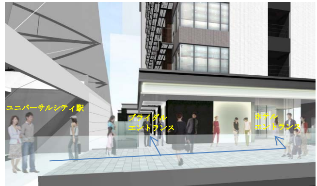
歩行者専用デッキのイメージ ※現時点のイメージであり変更となる場合もあります。