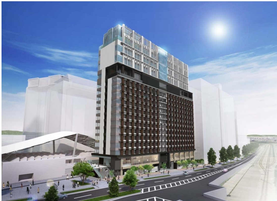
※現時点のイメージであり変更となる場合もあります。