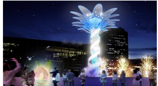
エモーショナル・クリスマスツリーイメージ