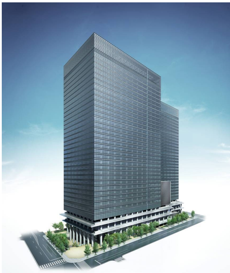
完成予想図（南西側から見る）