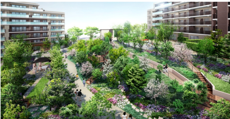
<貫通通路イメージ※>