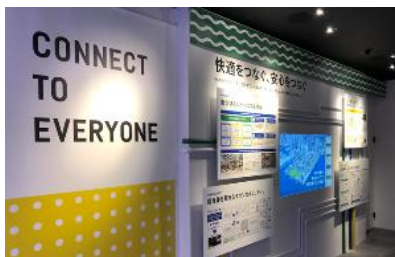
「CONNECT TO EVERYONE」コーナー (街のマネジメント)