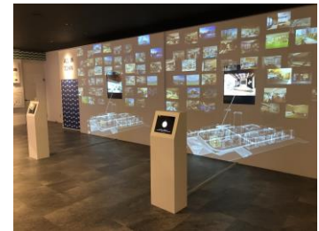
「ALL IN TOWN」コーナー (街にそろう施設と共用スペース)