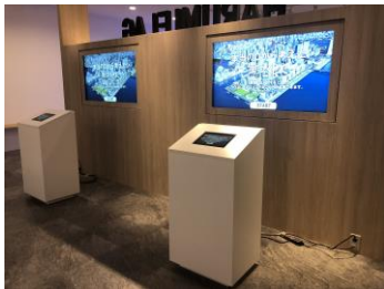
「BORDERLESS」コーナー (ゼロからの一斉開発)

街づくりの仕組みや新たな交通機関「東京BRT」・新しい駅「マルチモビリティステーション」、共用スペースや施設の紹介、中庭空間の見どころなど、5つのコーナーにて街の魅力を分かりやすく解説いたします。