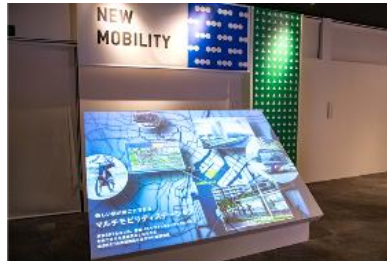
「NEW MOBILITY」コーナー (新たな交通機関「東京BRT」)