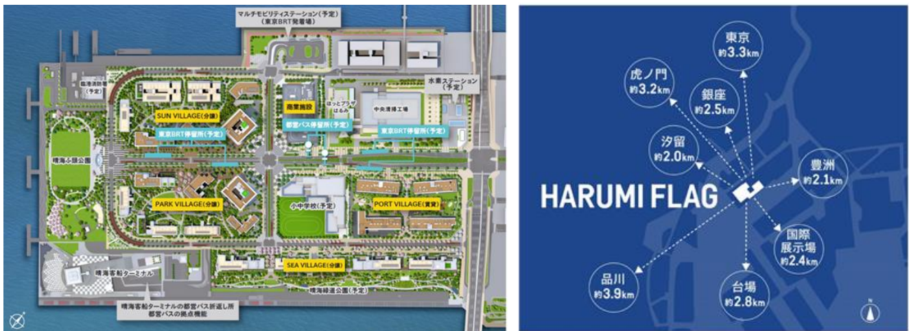
主要エリアまでの距離