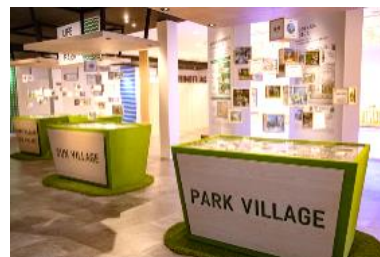
「LIFE IS PARK」コーナー (中庭紹介)