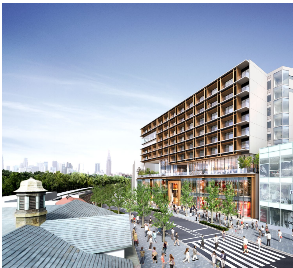
外観全景イメージ

（「WITH HARAJUKU RESIDENCE」公式サイト URL： https://wellith.jp/withharajukuresidence/ ）