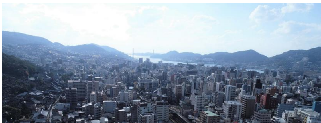
高層階からは長崎湾を一望

※2 「クワッドロックシステム」はエントランスから玄関までの四重のセキュリティのことを指します。