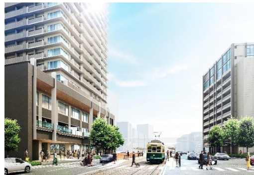
(左)北街区 (右)南街区

本事業は、新大工町商店街を含む中心市街地の活性化実現を目的に推進している再開発事業であり、そのうち分譲マンションの開発をJV5社で推進しています。国道34号と長崎電気軌道「新大工町」電停徒歩1分に位置し、利便性の高いエリアです。北街区には商業施設と住宅、国道34号を挟んだ南街区には駐車場と業務施設を設け、二つの街区は新設される歩道橋でつながる予定です。本マンションは、北街区に建設される地下1階・地上26階建て複合ビルの4階から26階に位置し、長崎県内最高峰※1タワーマンションとなります。