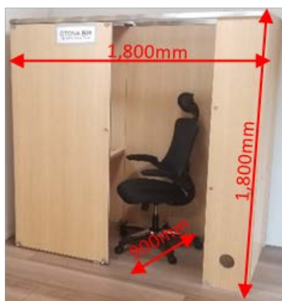
「ウエリスカスタム OTONA 基地」

長年、住宅やオフィスの開発を進めてきた当社は、ウィズコロナ時代における在宅ワークなどの働き方の変化と向き合うために、このたび、株式会社ユナイテッドとのコラボレーションにより、「ウエリスカスタム OTONA 基地」を共同で企画いたしました。