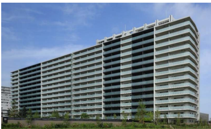
ウエリス浦和美園ノーステラス 外観