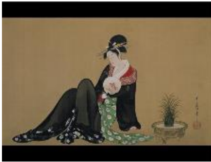
喜多川歌麿 納涼美人図