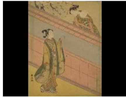
鈴木晴信 鞠と男女