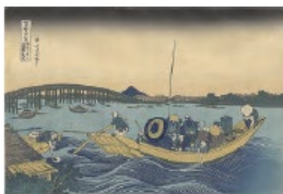
御厩川岸両國橋夕陽見