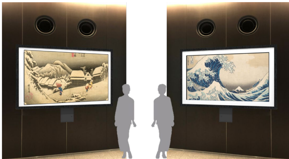
秋葉原 UDX 5F エントランス 設置イメージ図