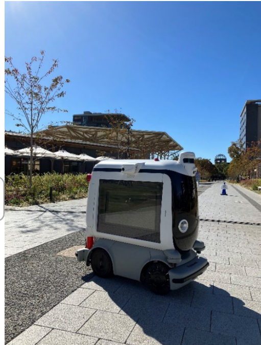
<走行ルート> ※走行ルートは日により変わります <走行ロボット (ハコボ)>