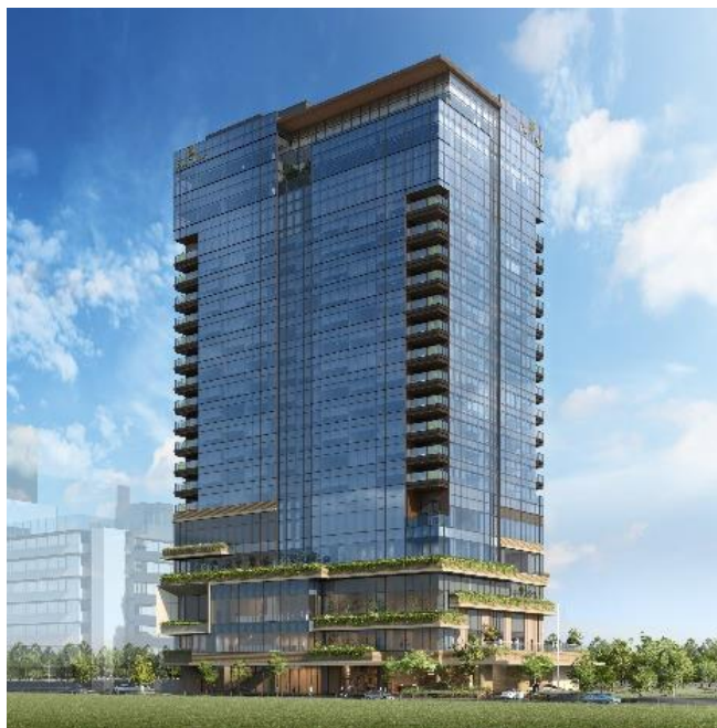
パティーナ大阪 外観イメージ

当社はこれからも、環境性能に優れた建物の開発などを通じて、持続可能でカーボンニュートラルな社会の実現に貢献してまいります。