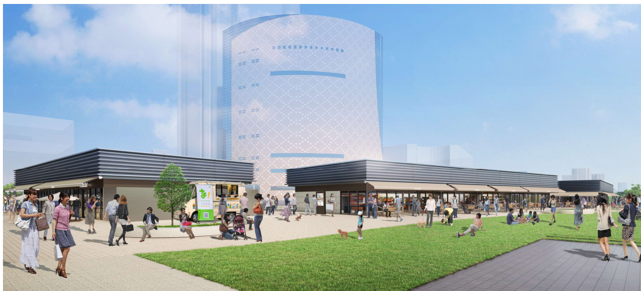
商業施設『なノにわ』のイメージ（南東側より）

『難波宮跡公園「みんなのにわ」プロジェクト（以下「本グループ」）』（代表構成員：NTT 都市開発株式会社）は、公園と一体となった商業施設『なノにわ』を 2025 年 3 月 28 日（金）に開業することをお知らせいたします。