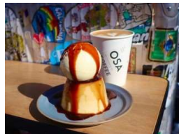
OSA COFFEE Parks