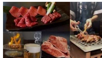
浪華焼肉さぶろう