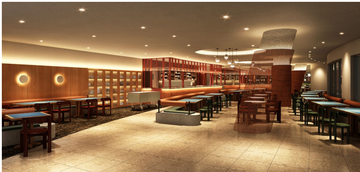
〈シェア型フードホール イメージ〉 ※今後の詳細設計により、デザインは変更になる場合があります

6階屋上庭園「スカイパティオ」に隣接するエリアには、全国にシェア型フードホール/横丁を展開する株式会社 favy（代表取締役社長：高梨巧、本社：東京都新宿区、以下 favy）により、シェア型フードホール【re:Dine 広島（仮称）】が登場いたします。