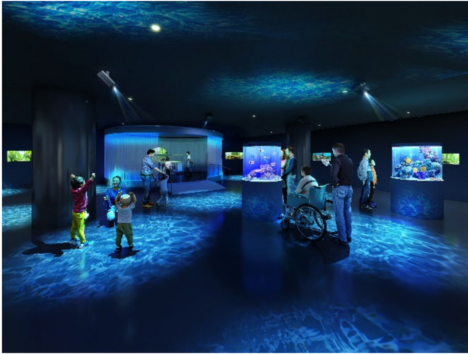
〈都市型水族館 イメージ〉 ※今後の詳細設計により、デザインは変更になる場合があります

7階には、広島市内唯一の水族館（2025年2月現在）として「都市型水族館」がオープンします。新生『パセーラ』の施設リニューアルコンセプトである「広島市都心部での過ごし方を変える」に基づき、お買い物や食事の前後に気軽に立ち寄れる空間として、リラックスしながら、生命の躍動を身近に感じる感動的な体験をお届けいたします。