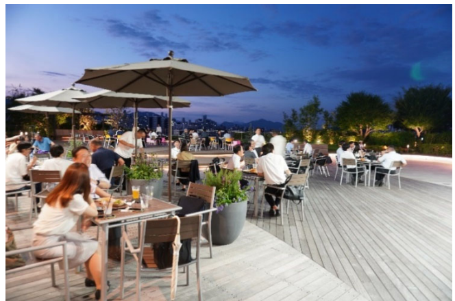
ビアガーデンイベント「Night View Beer」の様子