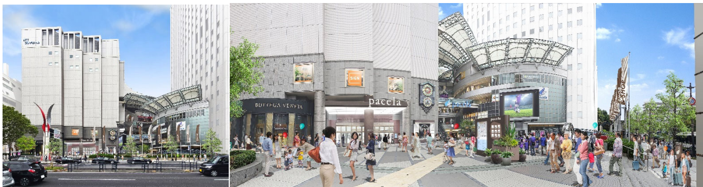
〈新生『パセーラ』の外観およびエントランス部分 イメージ〉 ※今後の詳細設計により、デザインは変更になる場合があります

※ 2 『パセーラ』とは、『天空の翼』という意味を象徴する言葉のシンボルとして paseo（散歩道/スペイン語）celeste（天空/ラテン語）ala（翼/ラテン語）から命名した商業施設名称です。