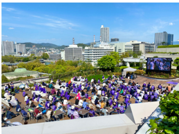
パブリックビューイングの様子

なお、今後のイベント情報は、当社が運営する公式HPや公式SNS（Instagram、LINE、X（旧Twitter）、Facebook）にて随時ご案内いたします。